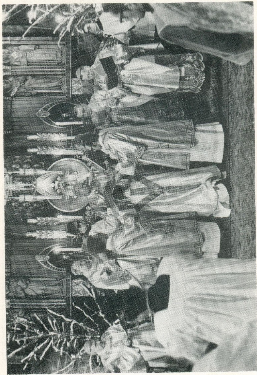
Ks. Kardynał Wojtyła i uczestniczący w ceremonii Księża Biskupi odmawiają modlitwy nad konsekrowanym