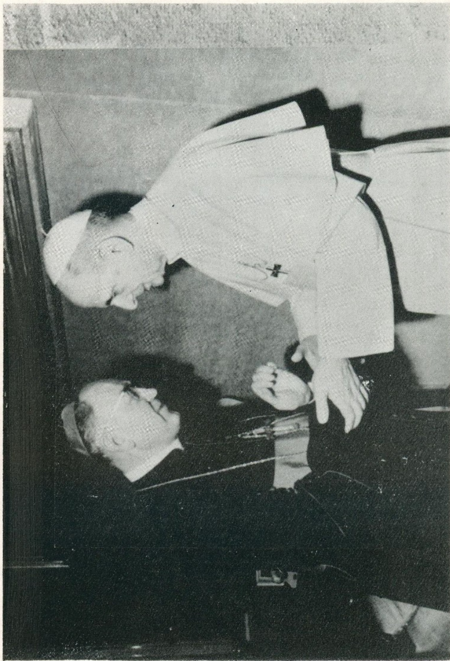
Ojciec Święty przyjmuje Ks. Biskupa Ordynariusza dnia 9. XI. 1973