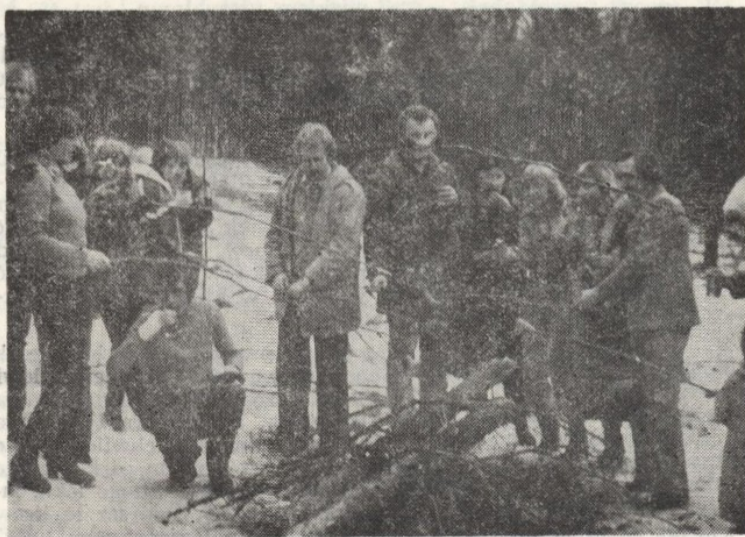
Po biegu przełajowym, przy ognisku, kiełbaska smakuje najlepiej.