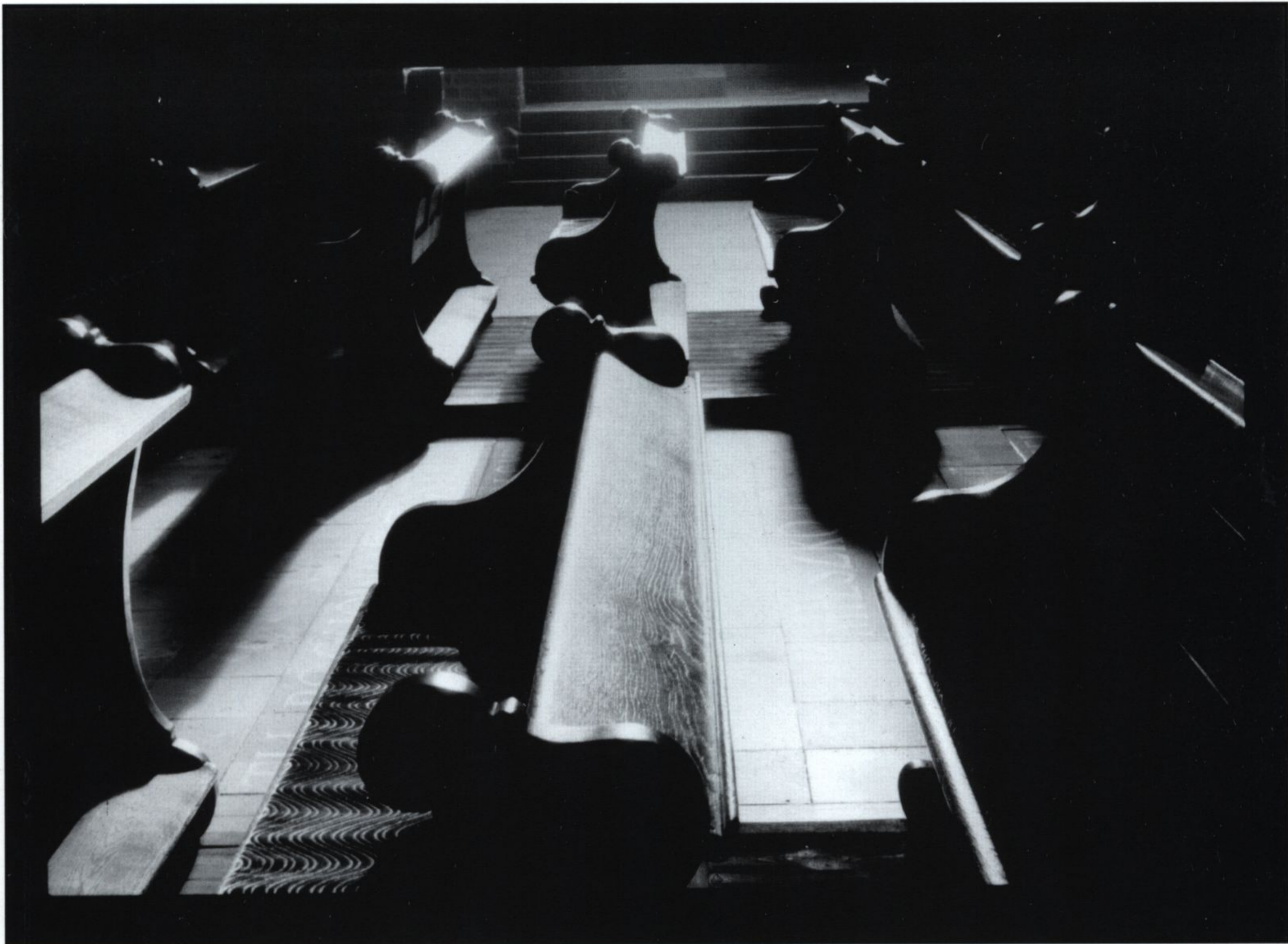
Maciej Andrzej Szymanowicz