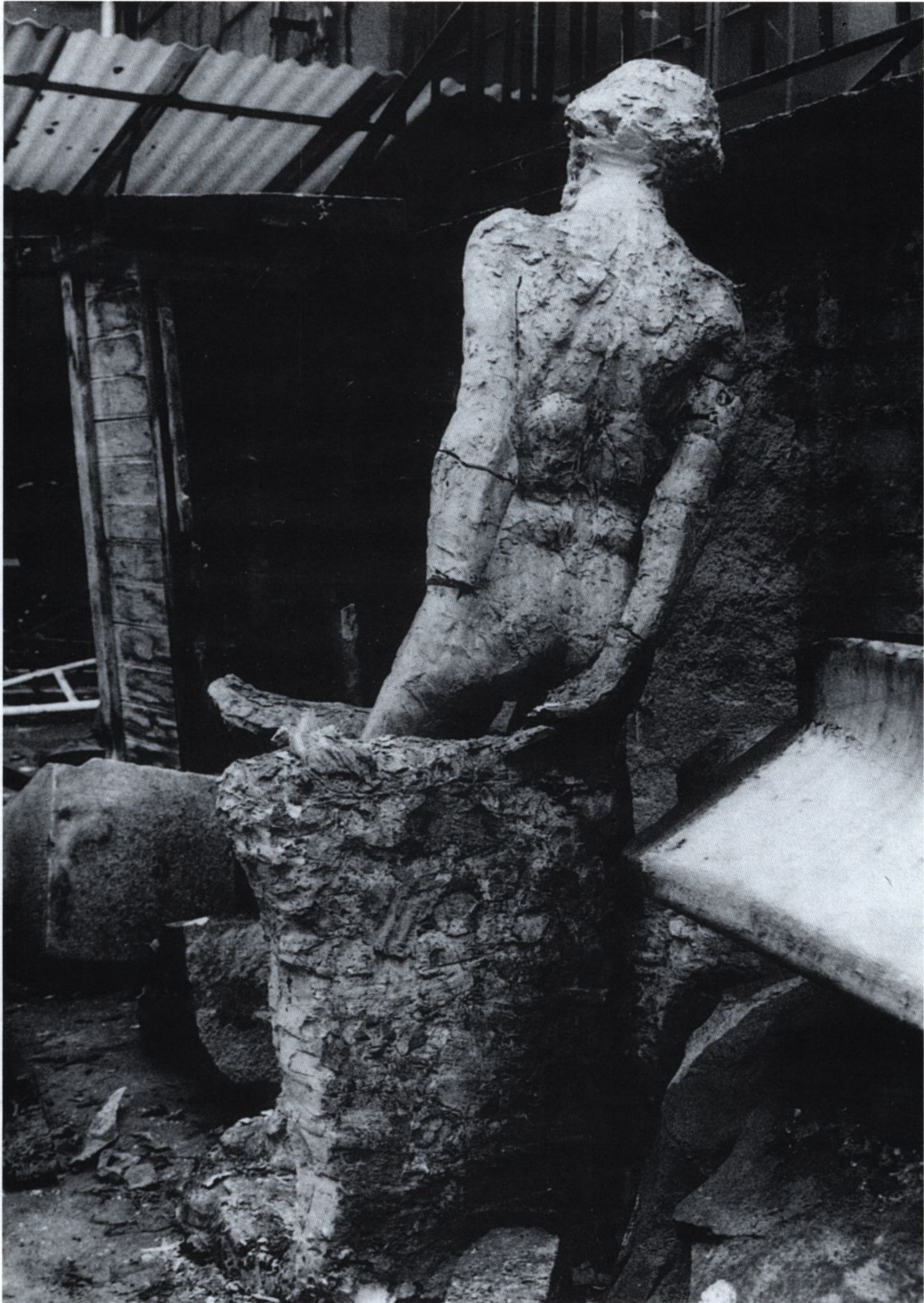
MACIEJ ANDRZEJ SZYMANOWICZ