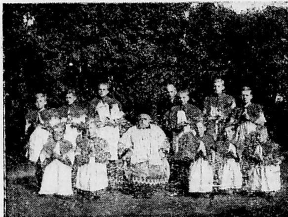
Grono ministrantów z Miętustwa ze swym zycznym ks. Proboszczem