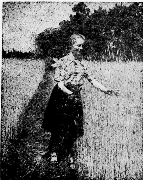
Jedna z czytelniczek Małego Tygodnika wśród dojrzewających zbóż