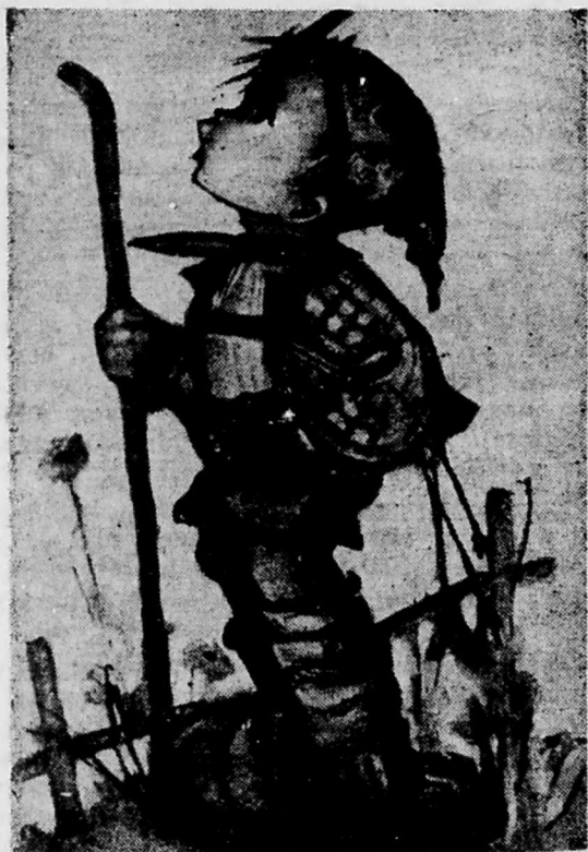
Wiosenna podróż w dziadziusiowych pantoflach