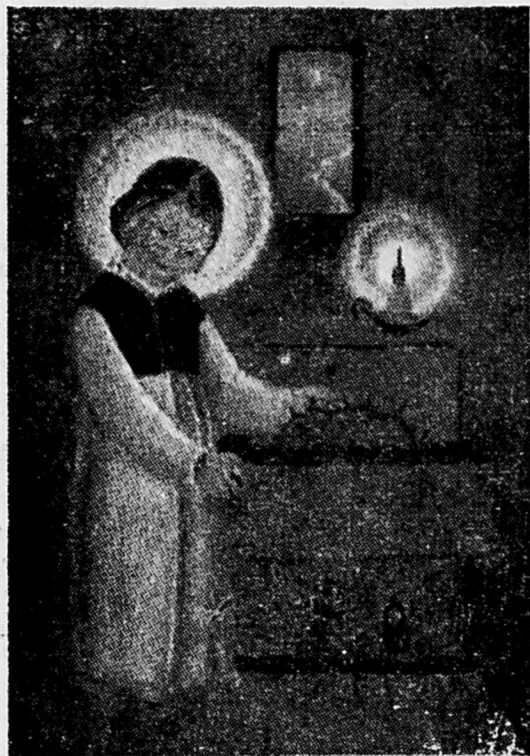
Pan Jezus wyjmuje cierniową koronę ze skrzyni.