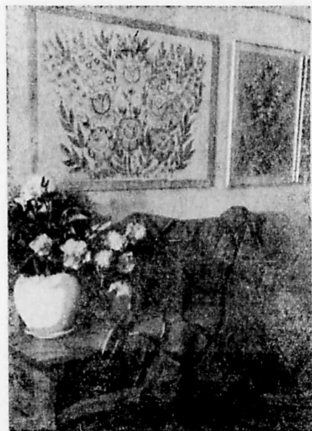
Fragment ściany z umeblowaniem w pokazowej izbie