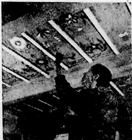
Rozalia Zaród przy malowaniu powaly izby krakowskiej w Muzeum Etnograficznym w Krakowie

Zamiar dyrekcji Muzeum, by pokazać imponujący wzór urządzenia i dekoracji wne-