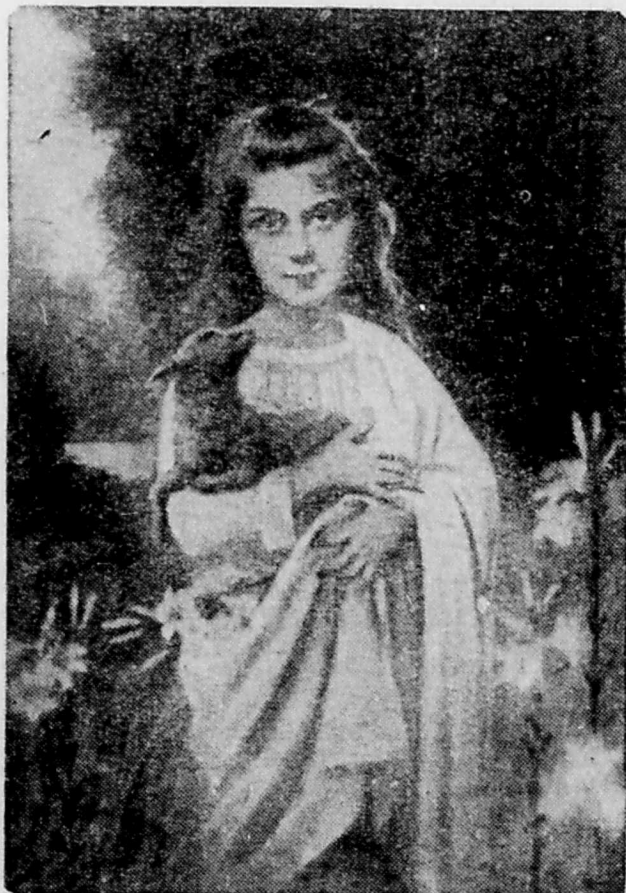
Święta Agnieszka, wzór dobroci chrześcijańskiej dziewczynki