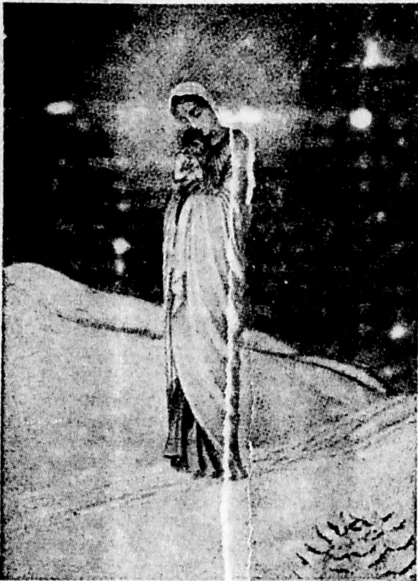
Zdrowaś bądź Maryja