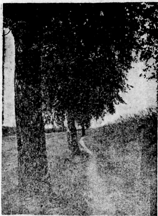
Piękna jest nasza polska jesień

Stare, polskie przysłowie mówi, że bez pracy nie ma kołaczy, innymi słowy — leniuchy nie mają na co liczyć w życiu, każdy człowiek odwróci się od nich z niechęcią. Człowiek uczciwy spełnia swoją pracę z radością, gdyż wie, że to jest jego obowiązkiem. I wy również musicie brać przykład z ludzi sumiennych i pracowitych, odrabiać swoje ćwiczenia szkolne, przyzwyczajając się do ciągłego wysiłku. Pamiętajcie, że praca, jeśli ma być dobra, musi być wytrwała. Pisaliśmy już o tym nieraz, kochane dzieci, ale warto jeszcze raz zwrócić na to uwagę w chwili, gdy praca szkolna idzie pełną parą. (h)