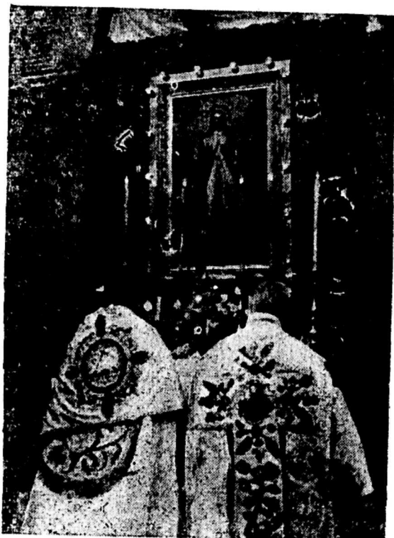
Ofiara Mszy św. ku czci Serca Jezusowego.