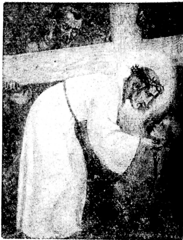
Zbawiciel: „Dla ciebie, moje dziecko“.