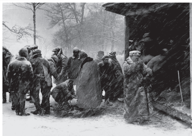
„Dawidgródek styczeń 1934”