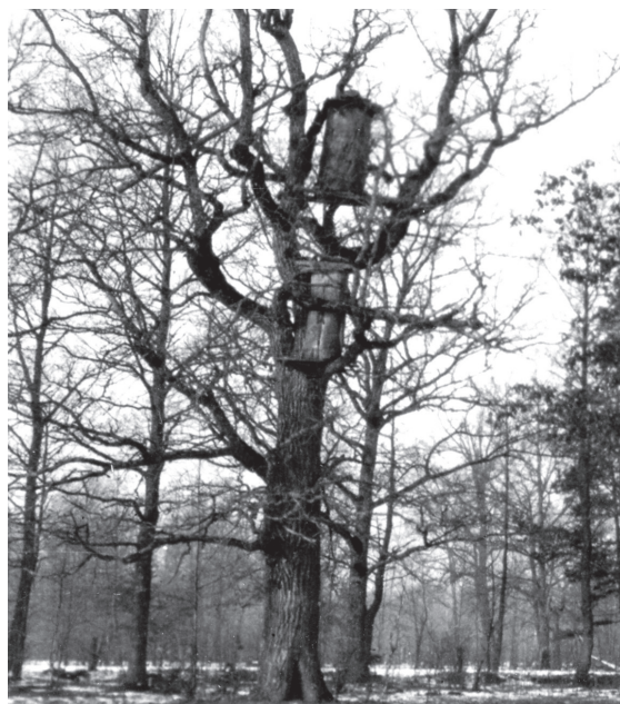
„Ochrona ula przed niedźwiedziem Barcie na dębie nadleśnictwo Berszty”