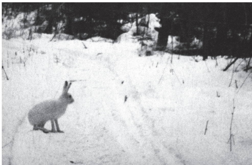
„Zając bielak na linii w Puszczy Rudnickiej”