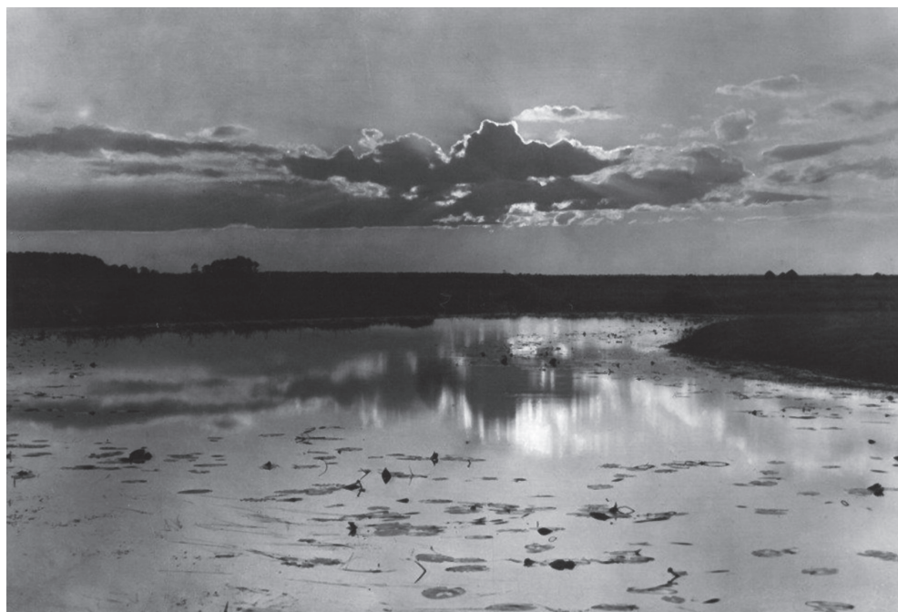
Karta pocztowa „Rzeka Bobryk na Polesiu” Jana Bułhaka, wyd. Książnica „Atlas” we Lwowie

Pierwsze fotografie powstawały w zakładach fotograficznych. Były to pozowane zdjęcia w atelier lub portretowe. Wraz z rozwojem techniki, zmniejszeniem wielkości aparatu fotograficznego, wynalezieniem migawki i skróceniem czasu naświetlania negatywu rozpoczął się okres wykonywania zdjęć plenerowych, wykorzystujących naturalne światło słoneczne.