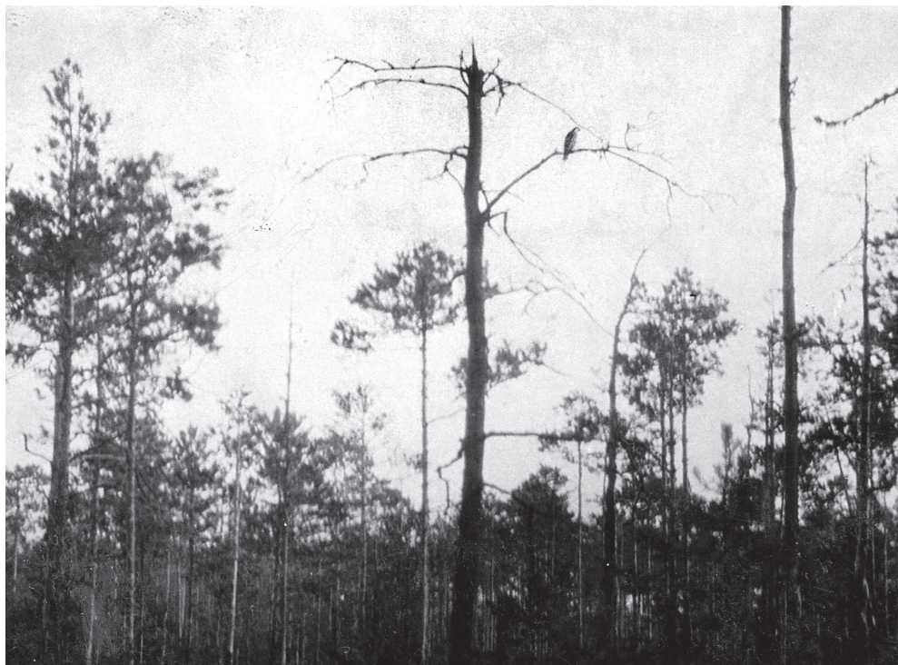
„Sokół na suchej sośnie w Puszczy Bersztańskiej”