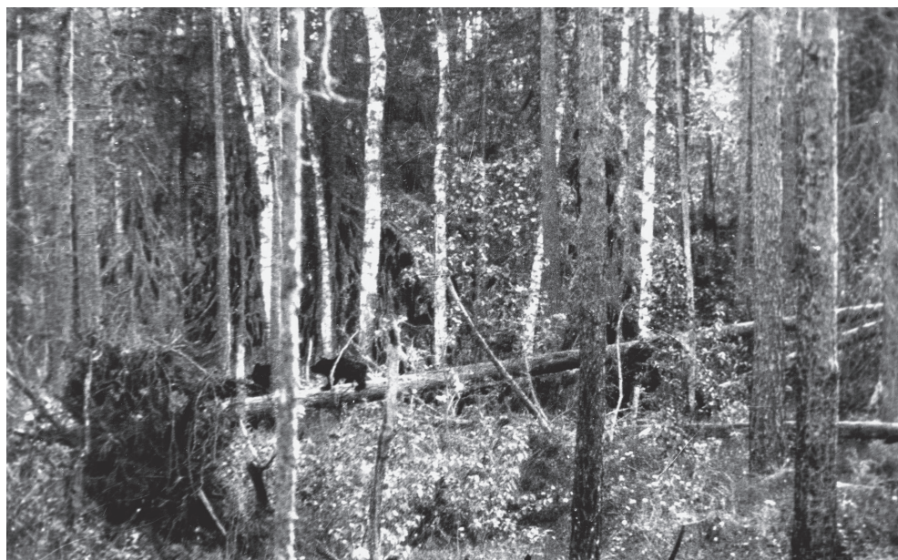
„Niedźwiadek na pniu za pniem niedźwiedzica, lasy poleskie Błota Hryczyno”