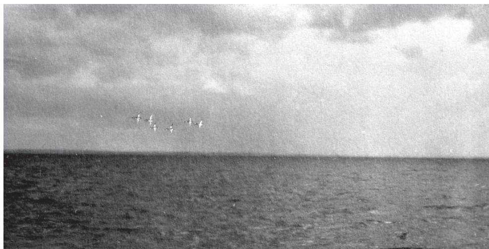
„Szlachary (tracz długodzioby) nad morzem”