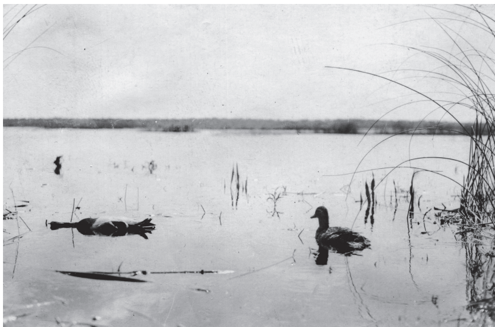
„Kaczor strzelony przy krekusze na Prypeci”