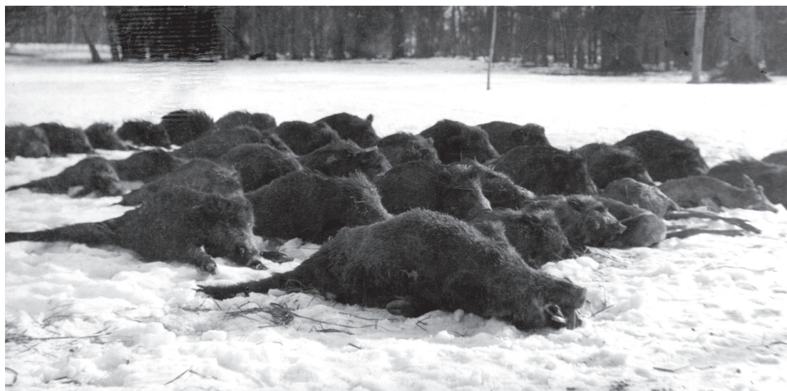
Pokot po polowaniu na dziki w dobrach Jarosława hr. Potockiego w Rzepichowie