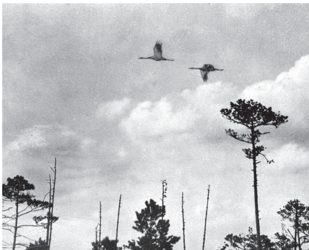
„Żurawie nad mszarem”