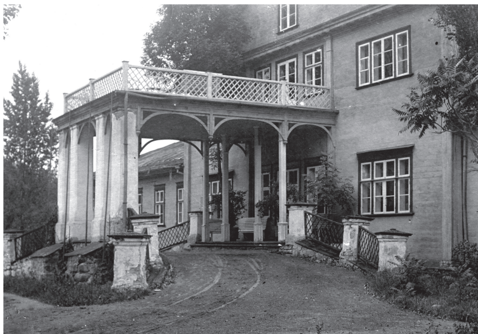
„Anińsk podjazd od strony dziedzińca”