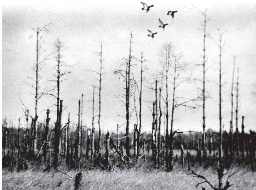
„Kaczory krzyżówki w maju po opuszczeniu ich przez samice”