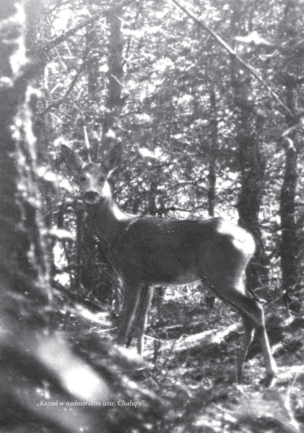
„Kozioł w nadmorskim lesie, Chałupy”