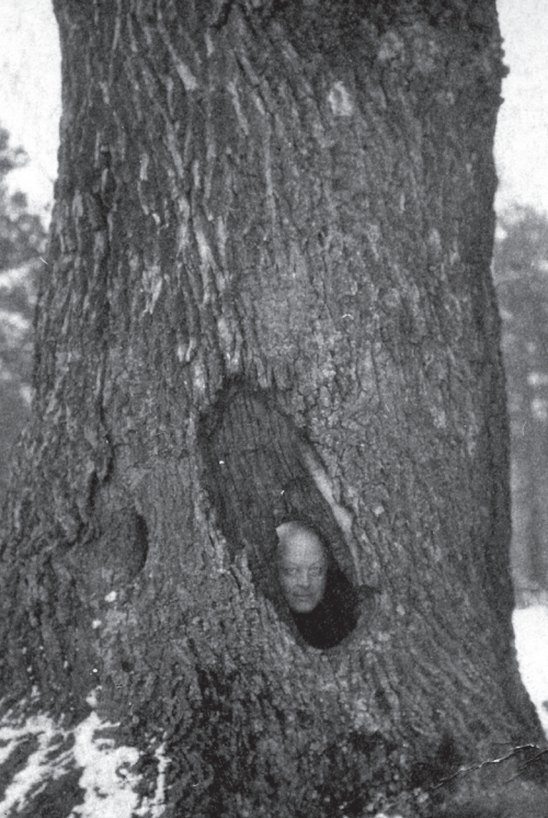
„Puchacz w dziupli”, Chotynicze