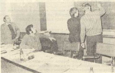
Podliczanie punktów zdobytych przez poszczególne drużyny