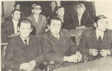
Wśród zawodników widoczne poruszenie