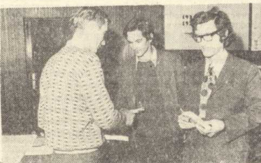
Nagrody dla zespołów kończących swój udział w konkursie