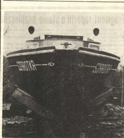
Szarotka z naszego klub żeglarskiego