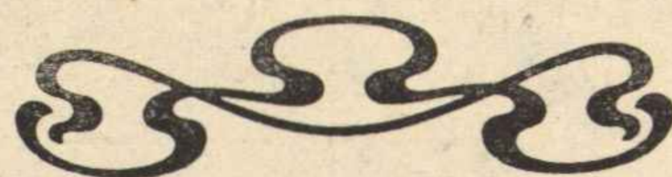
TABELA PO V KOLEJCE: