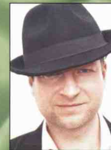
Artur Nełkowski AKTOR 1